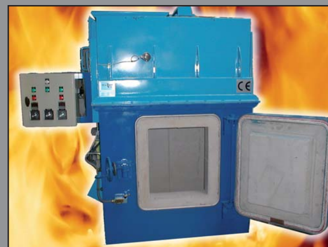
MODÈLE C. P. 30