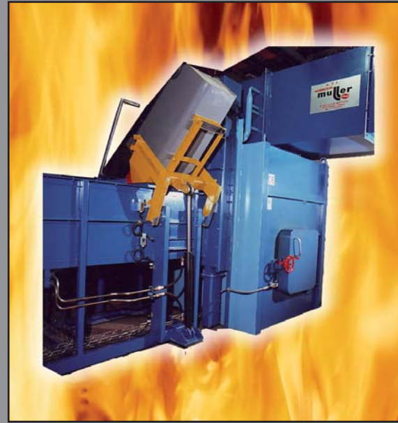
SEMI-AUTOMATIQUE SEMI AUTOMATIC SEMI AUTOMÁTICA

SYSTÈMES DE CHARGEMENT AUTOMATIQUE DES DÉCHETS AUTOMATIC WASTE LOADING SYSTEM SISTEMAS DE CARGA AUTOMÁTICA