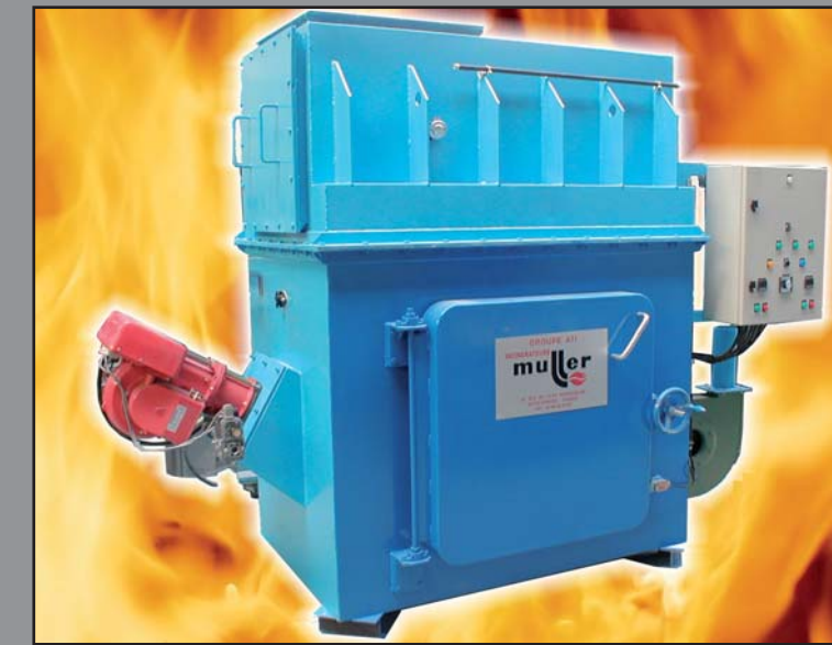
MODÈLE C. P. 80