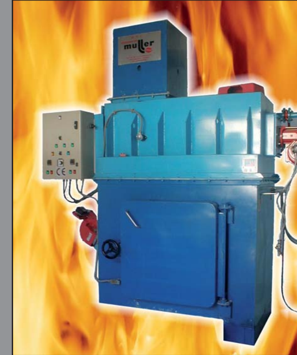
MODÈLE C. P. 50