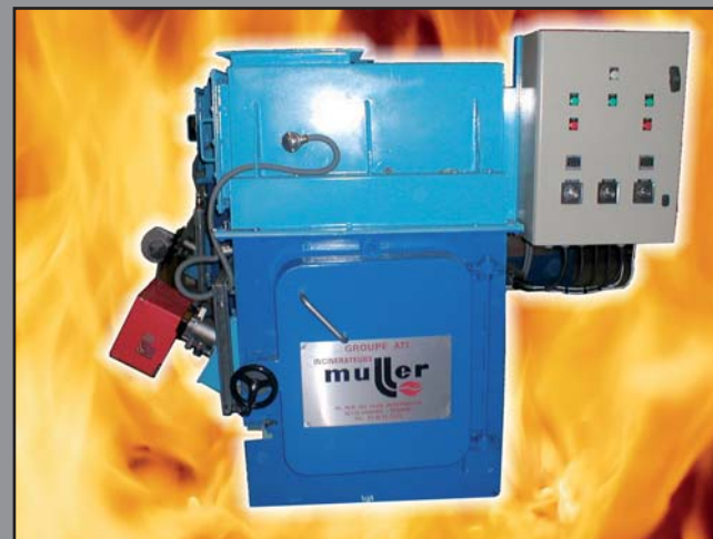
MODÈLE C. P. 15