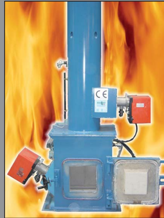
MODÈLE C. P. 5

CAPACIDAD DE DESTRUCCIÓN DE 5 HASTA 120 KG/H