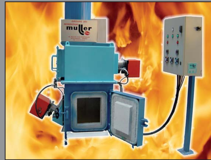
MODÈLE C. P. 10