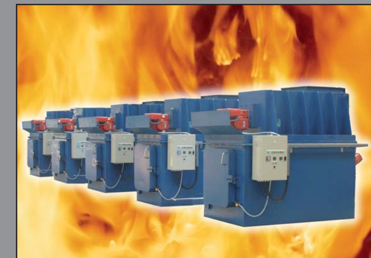
MODÈLE C. P. 100